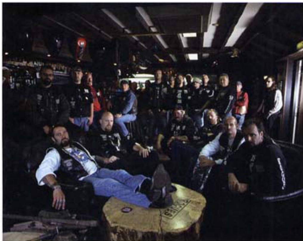
Groepfoto in clubhuis.

het geleerd heb in mijn reclamewerk. In een boek dat gaat over echte mensen is dat prachtig, want daarmee benadruk je nog eens de echtheid, de authenticiteit