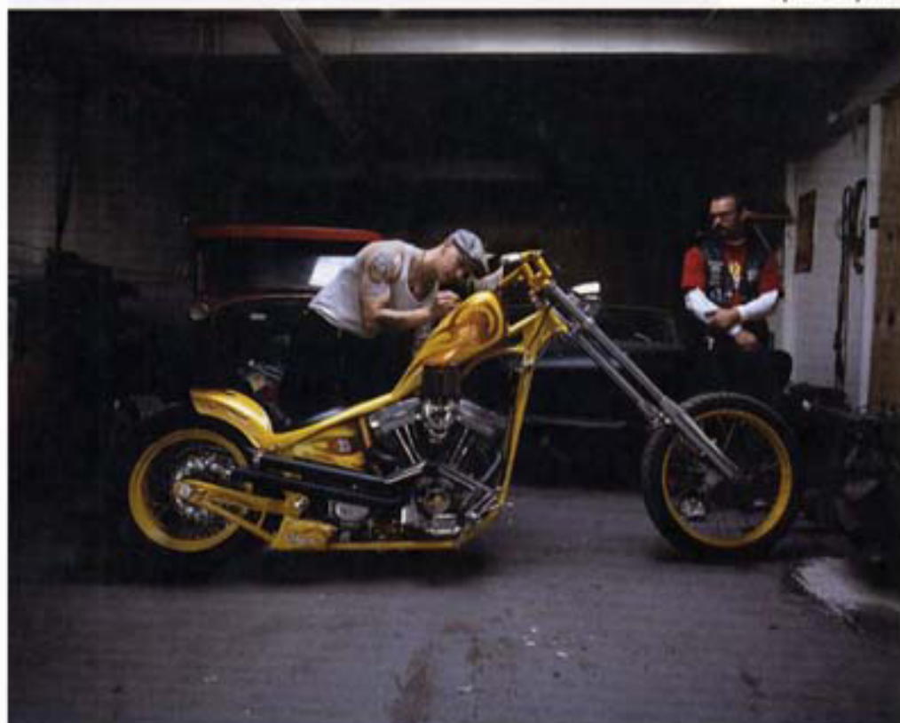
Spread Chop Beer.

den kracht die hij uitstraalt. Hij wil zich niet profileren, maar hij is gewoon zichzelf. Het mooie is dat in relatie tot die prachtige, beloftevolle vrouw, die twee een enorme power uitstralen. Meestal gebruik ik bestaand licht, maar hier heb ik licht van boven laten komen, waardoor die vrouw zoveel mooier uitkwam en de mise-en-scène iets theateraler is geworden. Gezien het onderwerp vond ik dat ik het licht een handje mocht helpen. Dat licht kon ik toepassen omdat ik